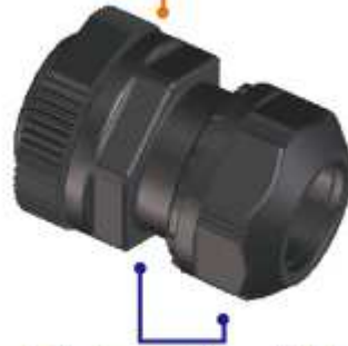
2: 本体 (ニップル) - 締付キャップ