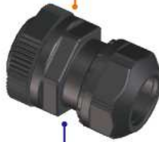
2: 本体 (ニップル) - 締付キャップ